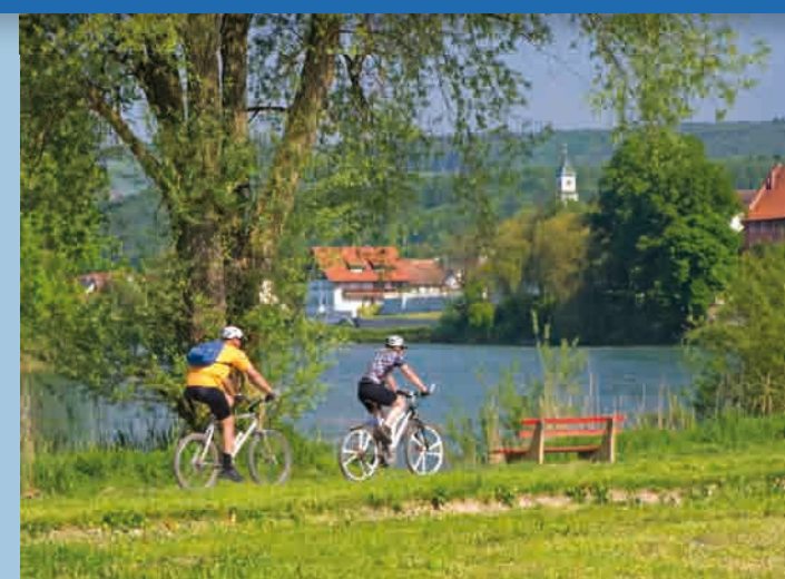
Radeln am Hochrhein, bei Kadelburg