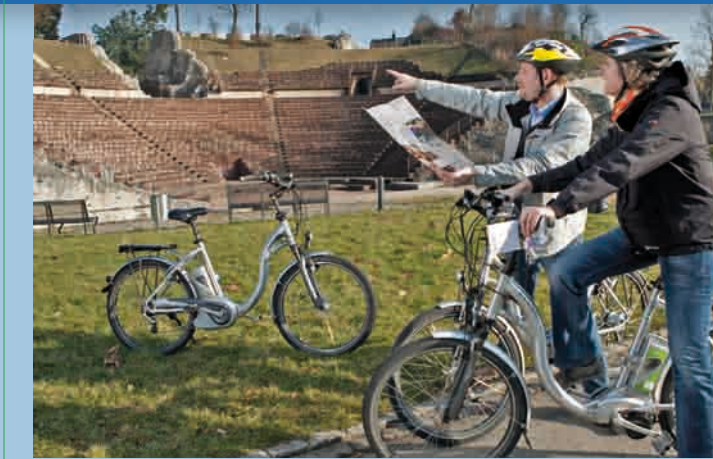
E-Biker beim Theater, Augusta Raurica