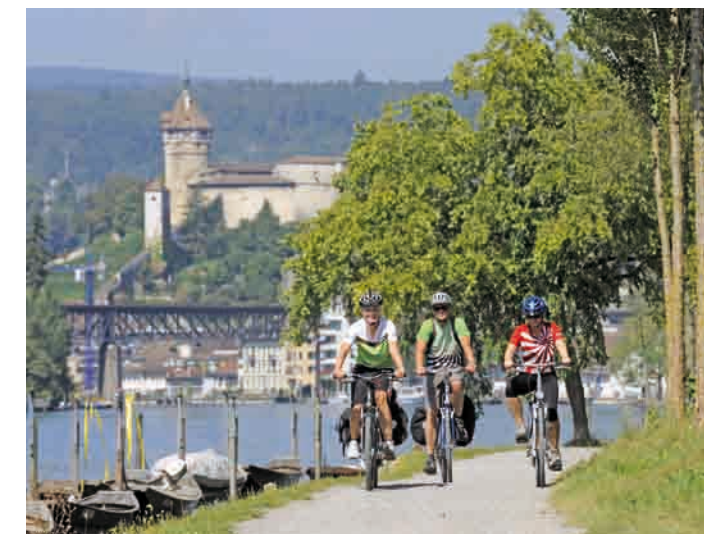
Uferradweg bei Schaffhausen

Beiderseits des Hochrheins liegen nationale Radrouten (s.a. Übersichtskarte: rechtsrheinisch Rheintal-Radweg / D 6/8, linksrheinisch Rhein-Route 2), weshalb jeder seine Route individuell an den vorhandenen Attraktionen ausrichten kann. Insgesamt 40 Rheinübergänge (Fähren, Kraftwerkstege, Brücken) erlauben es, das Ufer nach Belieben zu wechseln und so mal in Deutschland, mal in der Schweiz unterwegs zu sein (Ausweispapiere mitnehmen!).