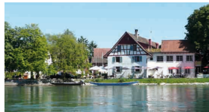
Ein Rastplatz am Hochrhein, Ellikon

Das Projekt Erlebnisraum Hochrhein unterstützt die touristische Entwicklung der grenzüberschreitenden Ferienregion in vielfältiger Art und Weise. Erlebnisraum Hochrhein wird getragen von den Landkreisen und Kantonen entlang des Hochrheins und ihren Tourismusinstitutionen. Gemeinsam sollen die grenzüberschreitenden Kontakte intensiviert und die vielfältigen Angebote am Hochrhein besser aufbereitet werden, damit sie dem Gast, wie auch den Einwohnern, leichter zugänglich sind.