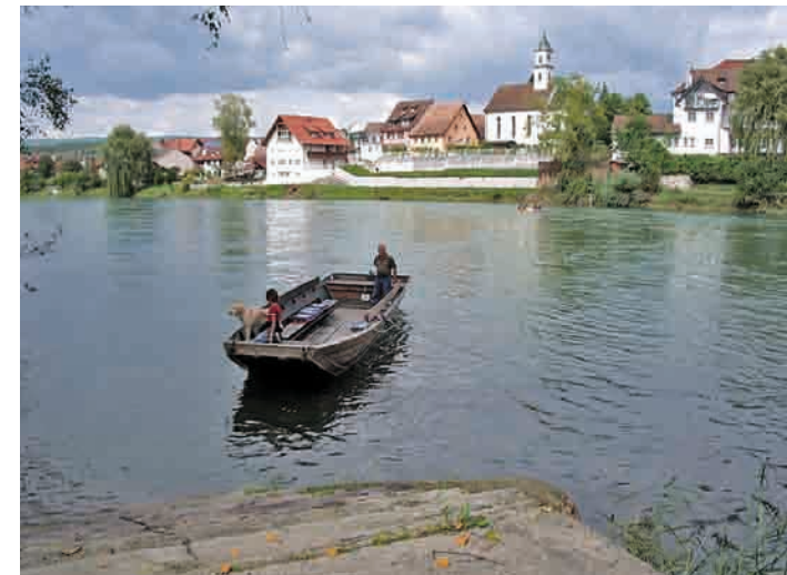
Fähre Kadelburg – Barz (Bad Zurzach)

In der Übersichtskarte sind die 40 für Radfahrer nutzbaren Rheinübergänge verortet und nachfolgend kurz beschrieben. Die beiden nationalen Radrouten entlang des Hochrheins, der rechtsrheinische Rheintal-Radweg (D 6/8) und die (überwiegend) linksrheinische Rhein-Route 2, sind dargestellt. Die Erlebnisroute am Hochrhein ist rot, die alternative Route ist orange eingefärbt.