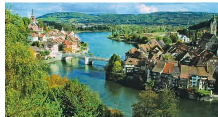
Beide Städte Laufenburg

Die grenzüberschreitende Region am Hochrhein bildete über lange Zeit eine kulturelle und sprachliche Einheit; auch politisch gehörte der westliche Teil bis vor ca. 200 Jahren in der Habsburger Herrschaft zusammen. Diverse Brückenstädte (Laufenburg, Rheinfelden) manifestieren diese Zusammengehörigkeit bis heute. Touristisch ist die Hochrhein-Region bislang nicht als Einheit aufgetreten.